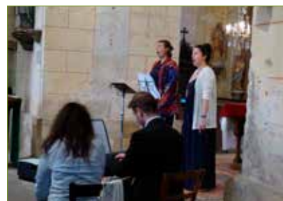
Concert de l'école de musique