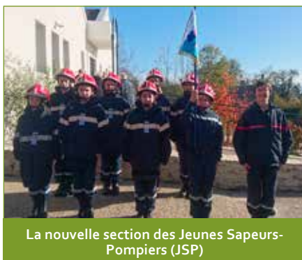
La nouvelle section des Jeunes Sapeurs-Pompiers (JSP)

Vous aurez certainement l'occasion de les croiser les uns et les autres aux alentours de la caserne ! Nous leur souhaitons, ainsi qu'à leur famille, la bienvenue et une bonne intégration à notre équipe qui compte désormais 5 femmes et 16 hommes. Au nom de tous les pompiers de Besson, je vous souhaite à toutes et à tous une excellente année 2020.