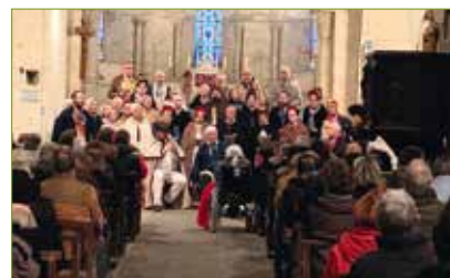
Concert de Noël de La Chavannée

Pour 2020, 3 dates sont retenues pour différents concerts, voir programme des festivités de l'année, dernière page du bulletin municipal.