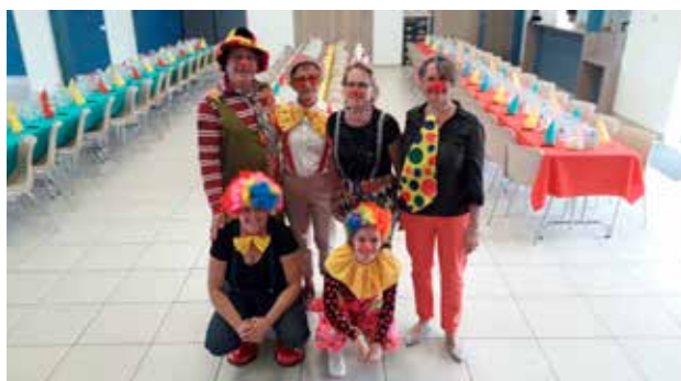
Repas du CCAS le 5 octobre sur le thème du cirque